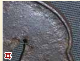
耳 鉄の強度を増す為にある

初めに鐔を作っていたのは、鉄を鍛えるのが上手な刀匠…刀匠鐔 戦争が増えると、刀の需要が増えていきました。と同時に、鐔の需要も増えていきました。そうすると、生産が追い付かなくなり、甲冑を作っていた甲冑師も余った鉄で作り始めました。(←甲冑師鐔) 二つの鐔の特徴は、デザインが全くないものか、小さい透かしがあるものです。