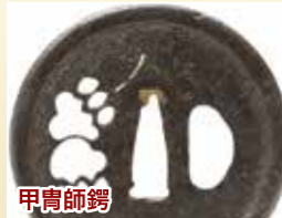
甲冑師鐔 鍛鉄を薄い板状に大きくして成型し、耳が角耳・打返し耳・土手耳の特徴が多い甲冑師鐔