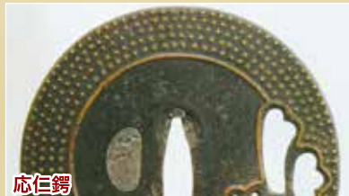
応仁鐔 薄い板状のものですが、真鍮で、線や点を象嵌し、櫃穴のまわりに象嵌を、装飾しているのが特徴です。

専門工が出てきたのが、室町後期ではないかと言われています。応仁の乱(1467-1477年)の時期に、作られていたのではないかとされている「応仁鐔」が、最初の専門工の鐔と言われているからです。安土桃山時代(1573-1603年)になると、透かしの図柄や象嵌など細かい装飾することが、流行していきます。すると、刀匠・甲冑師鐔がどんどん衰退していきました。日本のいろんな地域で、専門工が増え、有力武士に重宝されていきました。無骨なデザインから、装飾性の高いものに変化していきました。