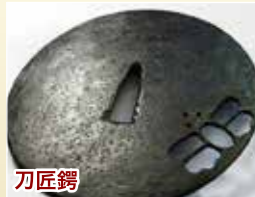
刀匠鐔 鍛鉄をととも薄く叩いて成型。